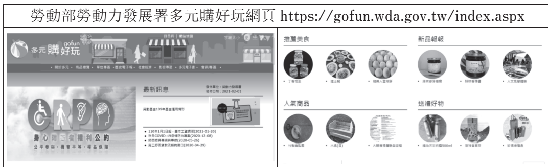
表 8. 勞動部勞動力發展署多元購好玩網頁截圖

筆者自2000年起參與勞動部多元就業方案輔導至今歷20年，於2010年提議組織大學生深入地方，關懷在地非營利組織社會型組織與產業，並示範執行「99年度多元就業開發方案社會企業學習體驗營」，以「課前學習、現地學習、影像採集、網路分享、設計回饋」為學習體驗模組，為公部門、學校、非營利組織與地方社會型產業融合推廣，立下了新標竿。(表 9)