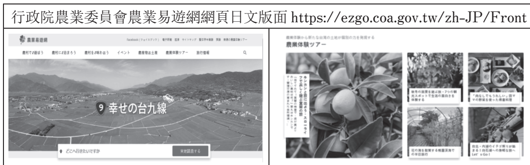
表 3. 行政院農業委員會農業易遊網截圖

為營造休閒農業友善旅遊環境，創新農業六級化增值整合成體驗遊程，提升人力素質及服務量能，朝向主題化、特色化、區域化、國際化及智慧化發展。截至109年底（民國），累計劃定96處休閒農業區，評鑑成績逐步成長並採分級分類方式予以輔導，期能全面提升區內農民整體經營休閒農業水準，並朝區域主題旅遊發展。輔導休閒農場取得許可登記證486家，運用場內資源開發農業體驗特色活動，提供遊客親近農業機會。輔導成立「田媽媽」農村料理114班，提供農村遊客具在地特色的美味料理或點心，豐富在地農遊特色。 (34) 此外為力推動地方休閒農業產業集群市場化，規劃農業易遊網，活化數位資訊，使利行銷與推廣。（表3）