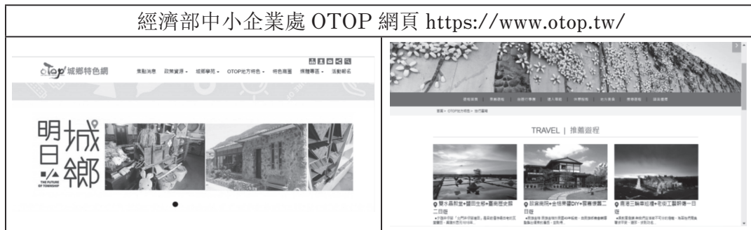
表 6. 經濟部中小企業處 OTOP 網頁截圖