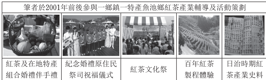
表 7. 筆者2001年前後參與一鄉鎮一特產魚池鄉紅茶產業輔導及活動策劃