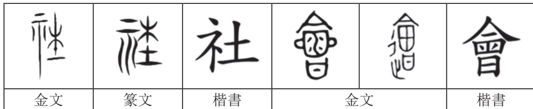
表10. 社與會漢字源流釋義

從漢字源流的釋義上看，「社」字隱含著在地集合組織的概念，「會」字隱含著共同分享食養之意；當代地方產業、在地資源、共同分享、身土不二等概念與主張或近其意。進一步說，當代漸為風潮之企業的社會性關聯與關懷，或主張非以股東利益極大化為目的社會企業觀點，在東方漢字文化圈的歷史與文化上早見端倪。