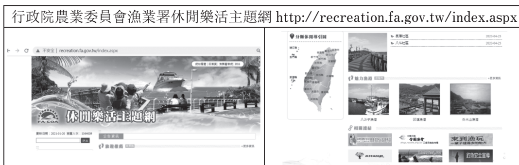
表 4. 行政院農業委員會漁業署休閒樂活主題網截圖