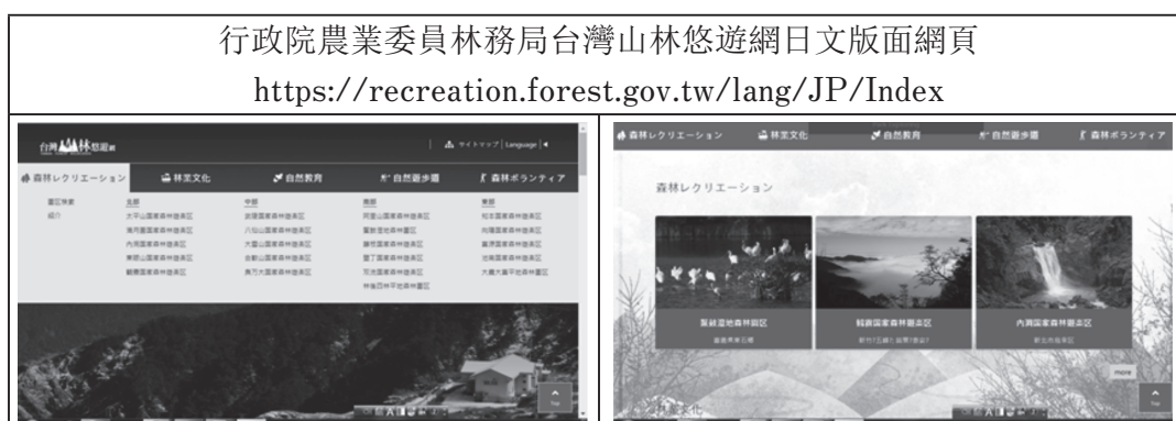
表 5. 行政院農業委員林務局台灣山林悠遊網截圖

台灣土地面積很小，僅 3 萬 6 千平方公里，是地球上的小國，然而從生物的角度來看，台灣是一個蒼翠的島嶼，生物種類繁多，不論是鳥類、蝴蝶、兩棲、蕨類、蘭花…等，以單位面積的種數排行，勘稱是世界上數一數二的大國。尤其台灣位處亞熱帶氣候區，山勢雄偉、四面環海，所造就的地質、地形、地景、氣候及生物上的豐富變化具備了發展生態旅遊的雄厚條件，其中以森林環境裡生物多樣性的表現最為突出，是生態旅遊的最佳場域。本局經營管理全國森林業務，為因應時代的變遷，配合民眾休閒遊憩及環境教育之需求暨突顯森林的普世價值，乃於全台森林區域內建置 18 處國家森林遊樂區，提供國人親近森林體驗自然的機會，其中推動森林生態旅遊是國家森林遊樂區經營的核心工作。 (36) (表 5)